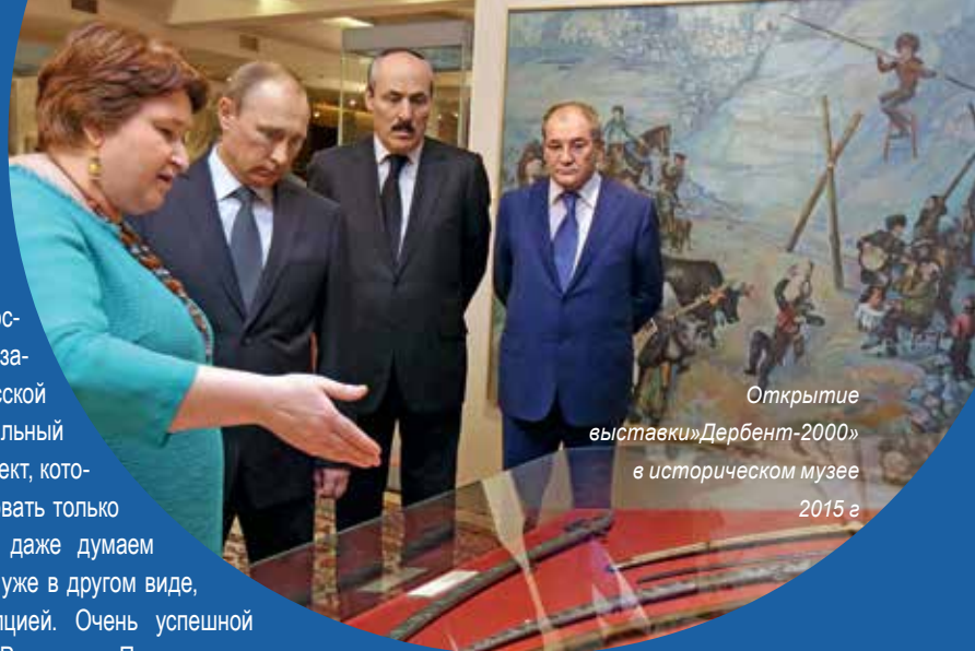
Открытие выставки «Дербент-2000» в историческом музее 2015 г

Собрание музея охватывает разные исторические пласты, разные сферы и направления. Сейчас общество все время ищет какие-то нити, связи — что же нас всех объединяет, что делает единым народом? Я считаю, что как раз история цивилизации, которая развивалась на наших землях, и есть эта объединяющая сила. И любой пришедший в Исторический музей человек может в этом убедиться, увидеть и ощутить, что вот здесь, на этой территории, формировалась наша историческая и культурная общность. И когда ты понимаешь это, осознаешь, что мы — единый народ. Нас связывает история, которая насчитывает не десятки или сотни лет, а тысячелетия.